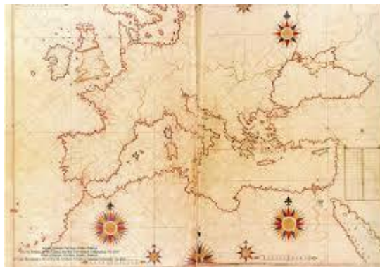
Carte du bassin Méditerranéen