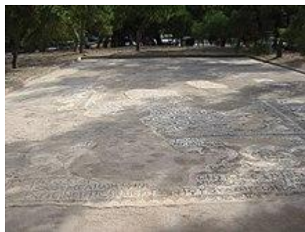
Mosaïque d'une synagogue romaniote en Grèce