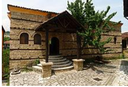
La synagogue romaniote de Bérée