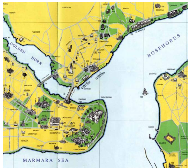
Plan simplifié d'Istanbul