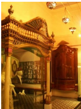
Ajuares de boda judios.

El museo judío de Estambul es una oportunidad de acercarnos a ese pasado, evidentemente no estamos hablando del mejor museo de Estambul y quizás debería estar mejor cuidado, pero a los que somos españoles nos facilitara el encuentro con un grupo de “compatriotas” que a lo largo de la historia han mantenido un vinculo especial con España pese a la lejanía.